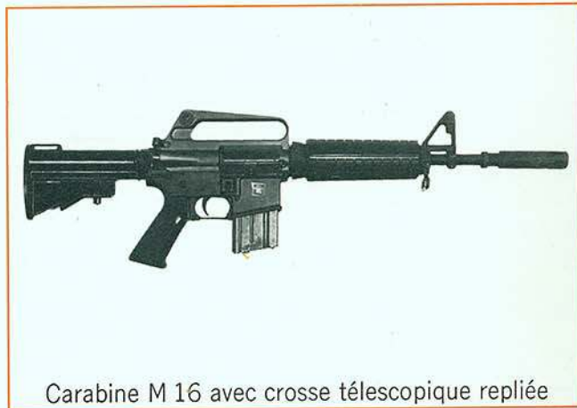
Carabine M 16 avec crosse télescopique repliée

Nota : La carabine peut être livrée avec une crosse télescopique type pistolet mitrailleur qui réduit la longueur au stockage et rend cette arme très utile pour l'emploi dans des véhicules ou en avion ou hélicoptère.